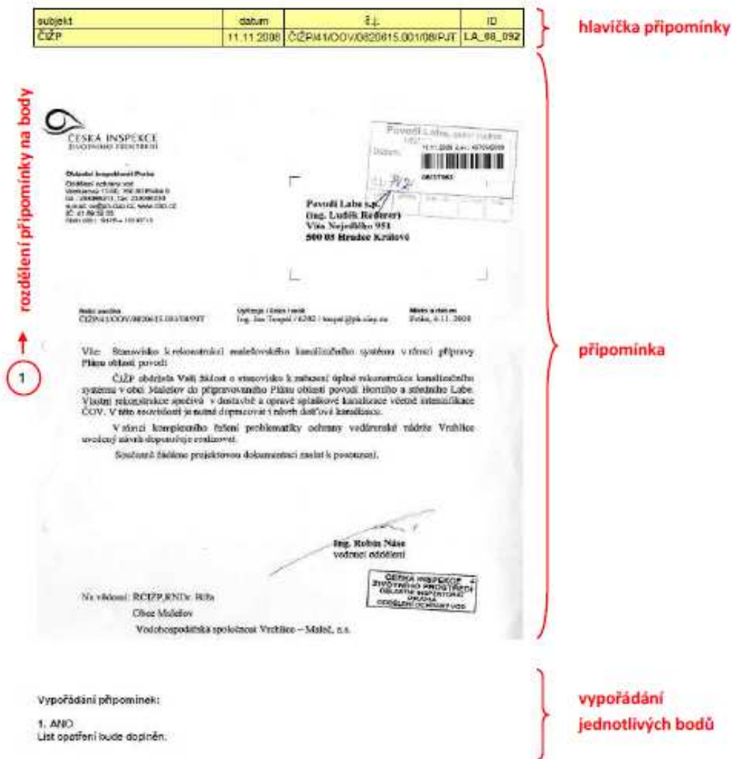
Obrázek č. 1 – Vzhled dokumentu připomínky

Vzhledem k tomu, že se připomínky v mnoha případech vztahují k více různým problémům nebo částem Návrhu Plánu oblasti povodí Horního a středního Labe, byly rozděleny na tzv. „body připomínek“. Každý bod je v textu připomínky označen číslem a pod textem připomínky je k jednotlivým bodům uvedeno vypořádání (viz Obrázek č. 1). Bod připomínky může být vypořádán těmito způsoby: