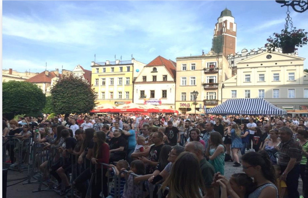
PRZEBUDOWA ZABYTKOWEJ PŁYTY RYNKU W PACZKOWIE - KONCEPCJA