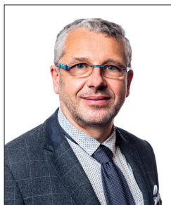
Arnošt Štěpánek náměstek hejtmána pro školství a sport

Pokud jsme vám alespoň trochu pomohli v rozhodování, jsem upřímně potěšen. Každému z vás přeji šťastnou volbu ve výběru střední školy, ať se daří ve studiu a následně i v povolání, které vás bude bavit a po celý život naplňovat.