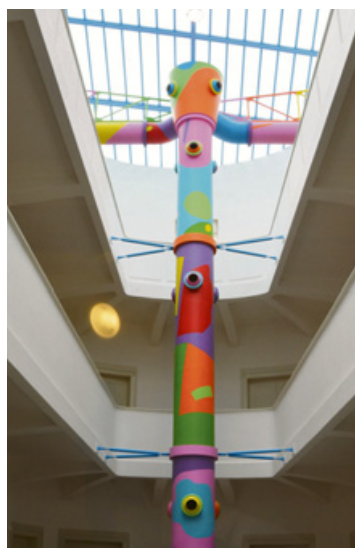
▲ Nově zrekonstruované výstavní prostory.

Oprava Galerie moderního umění a bývalého ústavu hluchoněmých, dnes Rudolfina, byly dvě největší investiční akce do památkově chráněných budov Královéhradeckého kraje za loňský rok. Finanční náklady obou rekonstrukcí se pohybují kolem 100 milionů korun a byla na ně poskytnuta dotace z ROP Severovýchod. I s ohledem na to, že se jedná o památkově chráněné budovy, jsme museli skloubit jak práci stavební firmy, tak památkářů. Výsledek se podle nás vydařil, ale posuďte sami... >