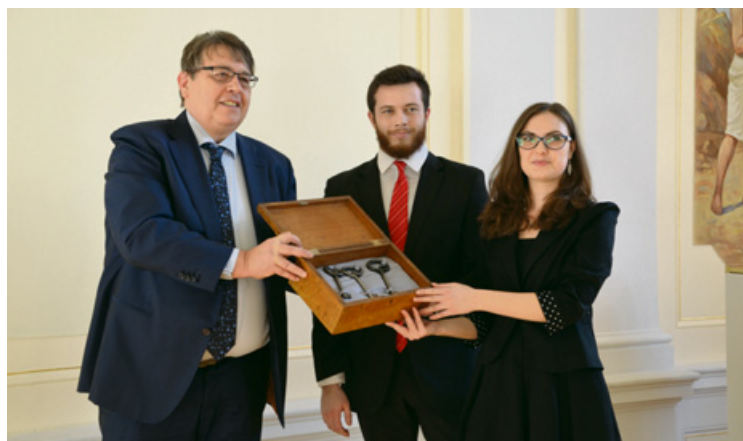
▲ Symbolické klíče od areálu Rudolfinu převzali od hejtmána studenti maturitního ročníku.