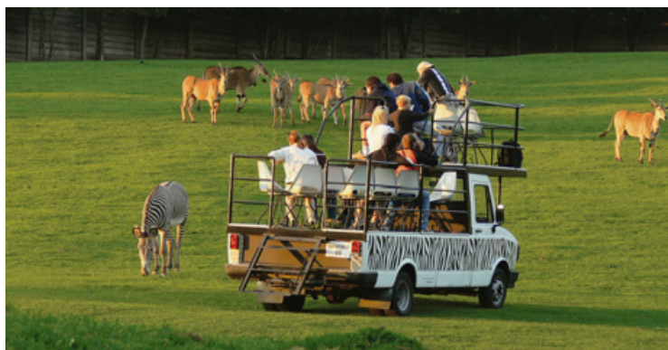
▲ Safari v ZOO Dvůr Králové - i takto dříve vypadala projížďka mezi zvířaty.