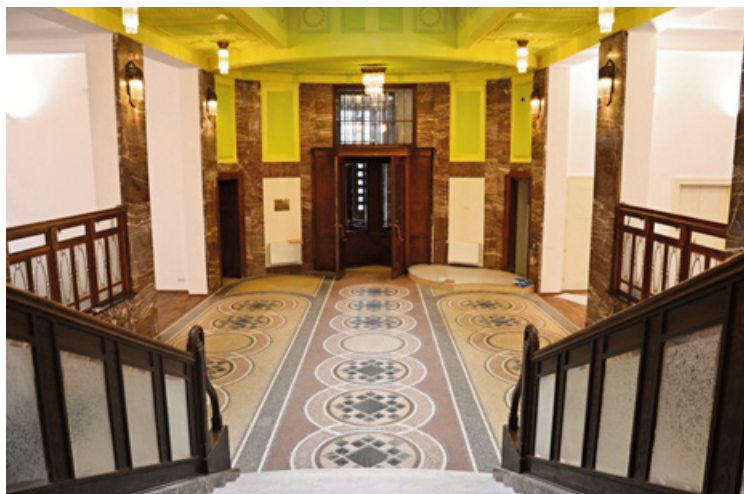
▲ Vstupní hala Galerie moderního umění.

Jako před stoletím. Tak nyní vypadá hradecká Galerie moderního umění po rekonstrukci. Po stavební části, která byla zkolaudována loni v listopadu, ji v současné době čeká instalace vnitřního vybavení. Veřejnosti by se měla galerie otevřít letos v červnu.