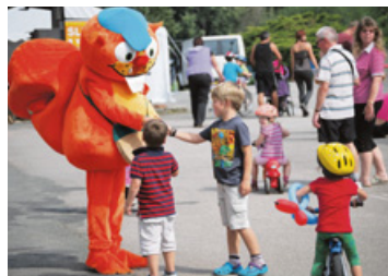
▲ Děti s maskotem Čendou.

Slevy tedy najdete v oblasti kultury a sportu, nákupů i ubytování. Můžete si tak s dětmi užít třeba i báječnou dovolenou. Držitelé Rodinných pasů dokonce využijí pas nejen na území České republiky, ale i u vybraných subjektů v Dolním Rakousku nebo na Slovensku. >