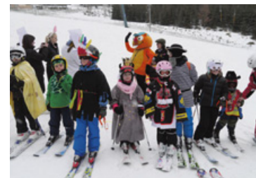
▲ Karneval na lyžařském kurzu.