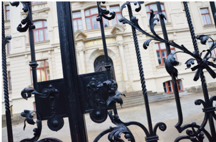
▲ Do budoucna by se měl opravy dočkat i historický plot kolem areálu.