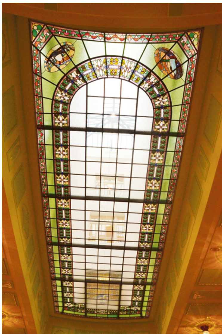
▲ Kompletní renovací prošel i skleněný strop ve vstupní hale.