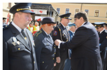
▲ Oceňování členů IZS na Den kraje.

Den kraje je již tradicí, která v Hradci Králové každoročně zpestřuje připomínku konce druhé světové války. I letos se dopoledne 8. května na Pivovarském náměstí sejdou představitelé krajské samosprávy, složek Integrovaného záchranného systému a další vzácní hosté, aby ocenili nejen ty, kteří se denně zasazují