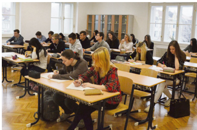
▲ Studenti hradecké obchodní akademie.

Přesné termíny přijímacího řízení i ukázkou z jednotných přijímacích testů naleznete na straně 7. >