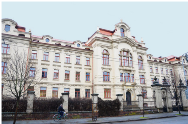
▲ Budova Rudolfinu dostala kompletně novou fasádu.

Novými nájemníky bývalého ústavu hluchoněmých, staronovým názvem Rudolfinum, na Pospíšilově třídě v Hradci Králové jsou žáci hradecké obchodní akademie a střední odborné školy. Podívejte se s námi do budovy nebo na to, jak vypadal první školní den 8. února 2016, kdy byla budova slavnostně otevřena. >