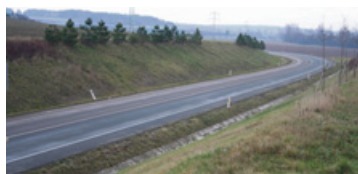
▲ Obchvat Solnice.

„Stavbu obchvatu Opočna bychom mohli zahájit v roce 2017. Rychnovský obchvat je ve fázi změny územně – plánovací dokumentace (ÚPD) a pracuje na něm přímo město ve spolupráci s ŘSD. Obchvat Domašína a Solnice koordinujeme my, opět ve spolupráci