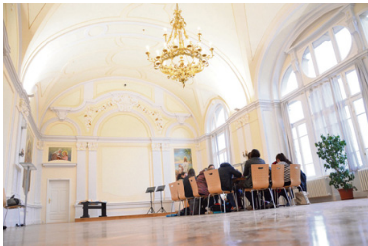
▲ V zapomenuté kapli bývalého ústavu hluchoněmých, která má výbornou akustiku, probíhá hudební výchova.