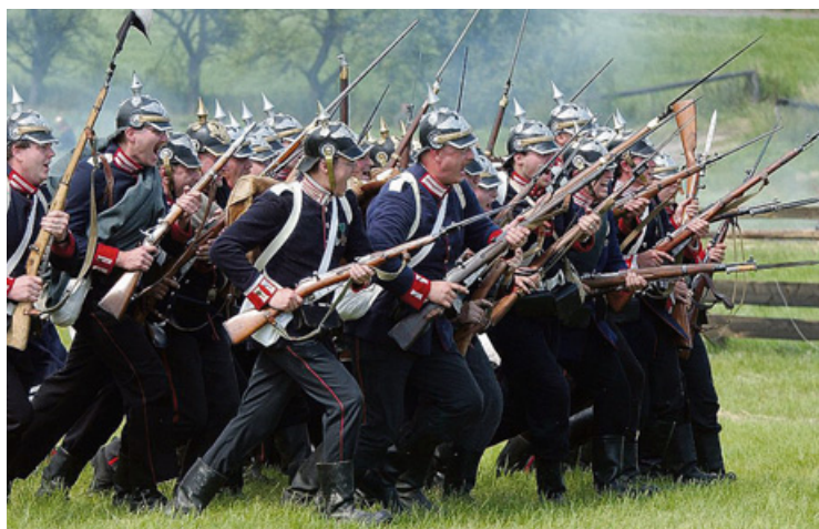
▲ Rekonstrukce bitvy 1866.

Například v rámci veletrhu Infotur a cykloturistika se 11. března uskuteční konference „Válka 1866 - potenciál pro cestovní ruch a vzpomínkové akce