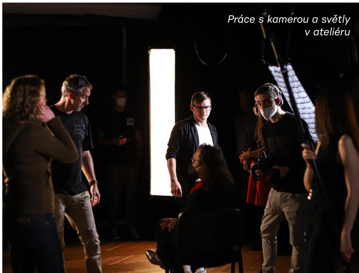
Práce s kamerou a světly v ateliéru