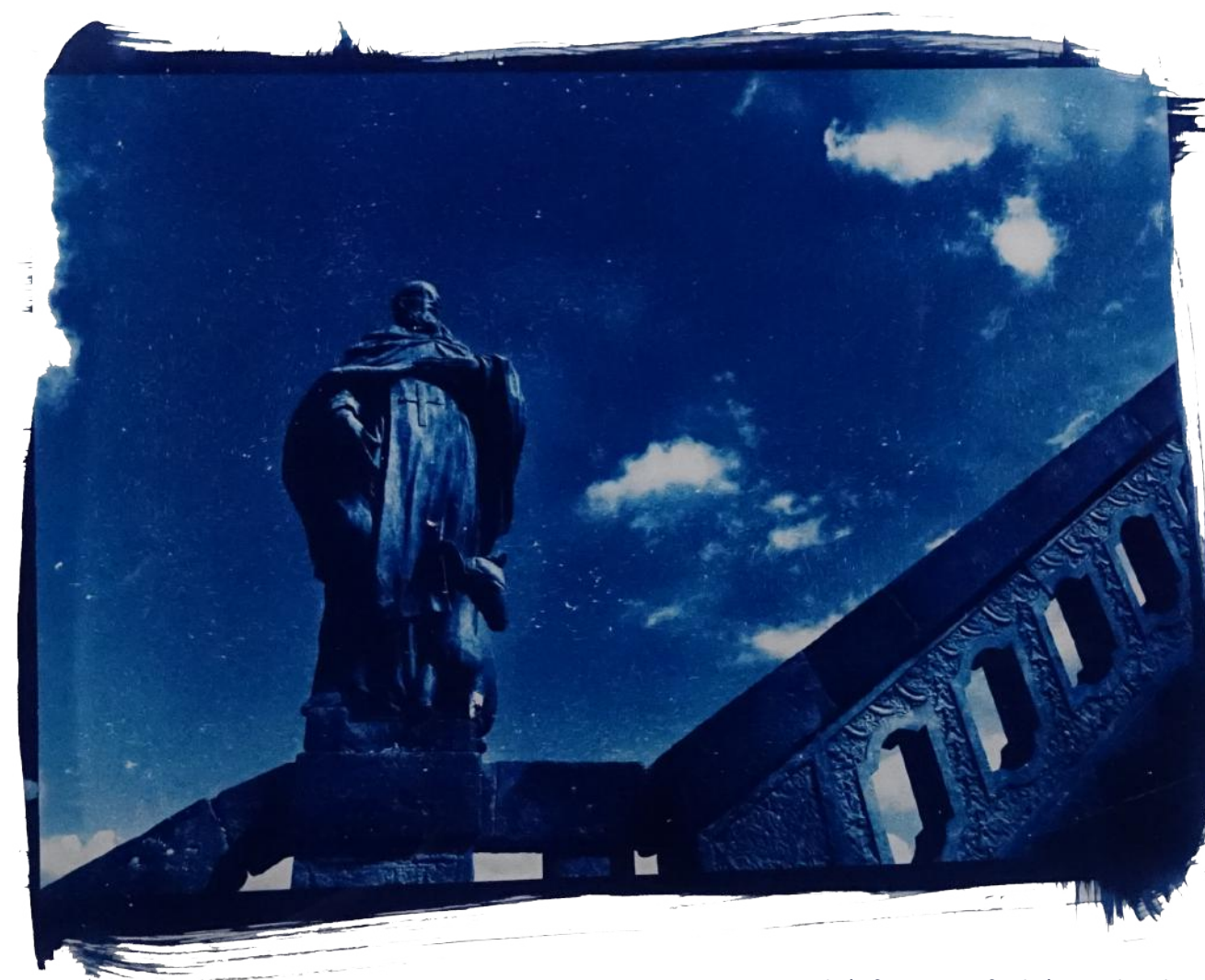
Historické fotografické techniky, Fotokomora CUA Hradec Králové

Filmy lze vidět na našem Youtube kanálu: https://www.youtube.com/watch?v=d7JmkJUx-H7o&list=PLB63jxllYYZd8OTFqCgTCppmDOZ-kE7UAA