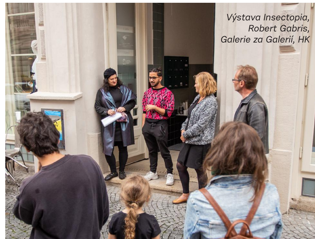
Výstava Insectopia, Robert Gabris, Galerie za Galerií, HK