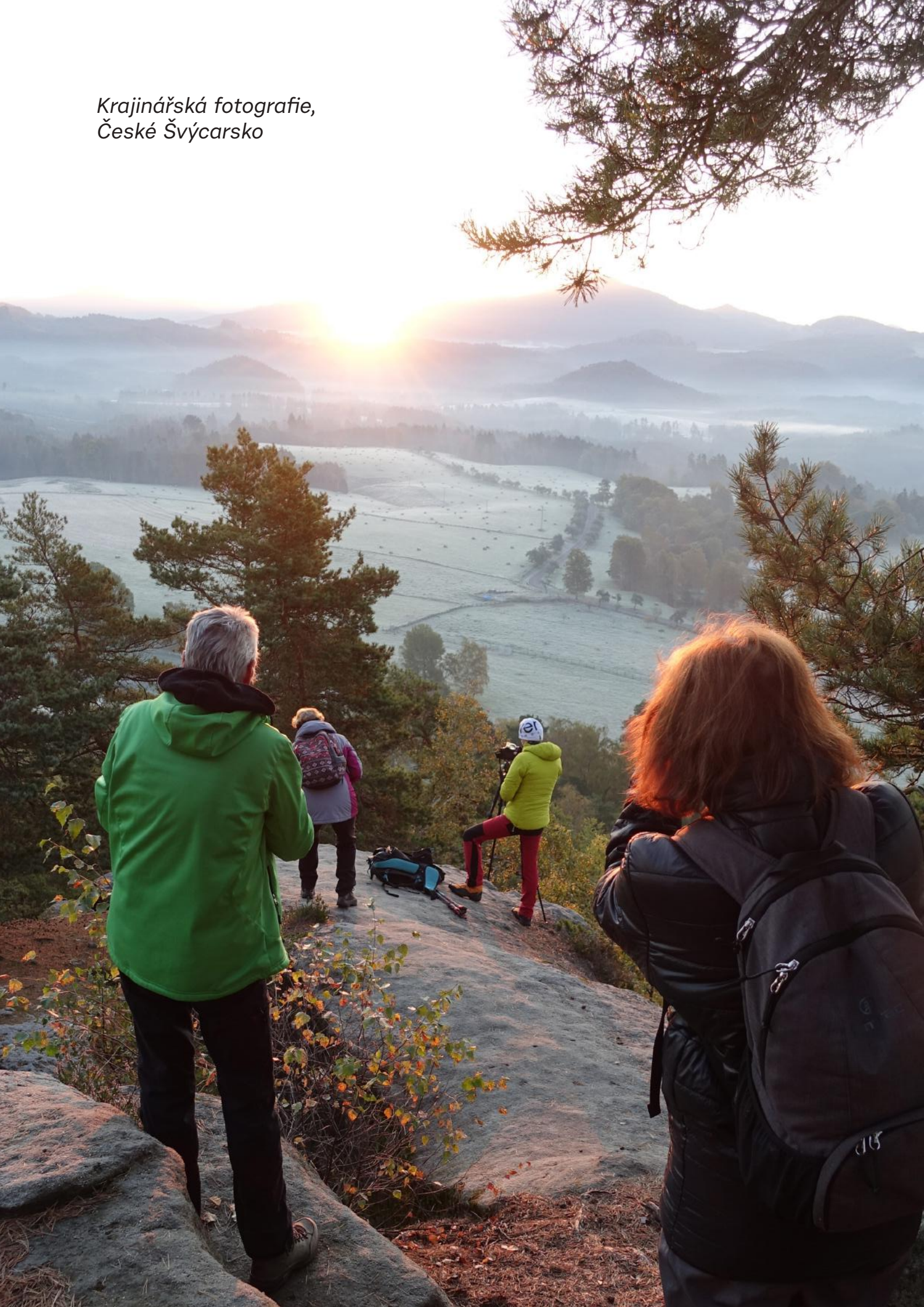
Krajinářská fotografie, České Švýcarsko