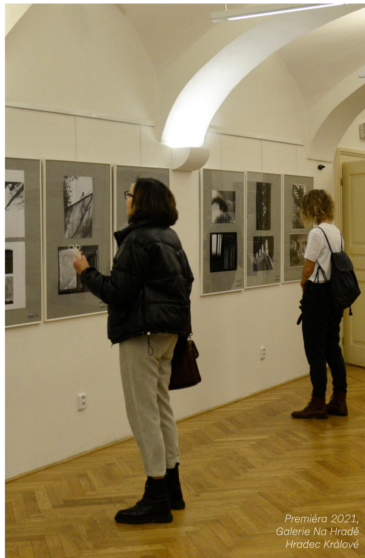
Premiéra 2021, Galerie Na Hradě Hradec Králové