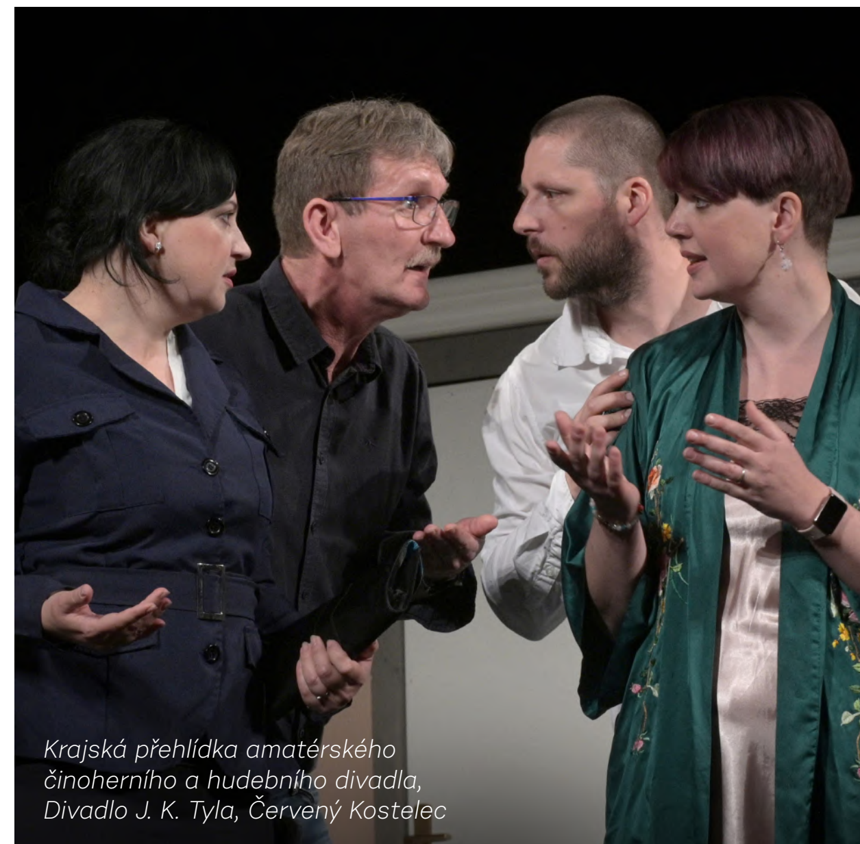
Krajská přehlídka amatérského činoherního a hudebního divadla, Divadlo J. K. Tyla, Červený Kostelec

Jejich podcastsi lze poslechnout zde: https://anchor.fm/jeliboknihu/episodes/Tak-jme-tady-e1a21rq