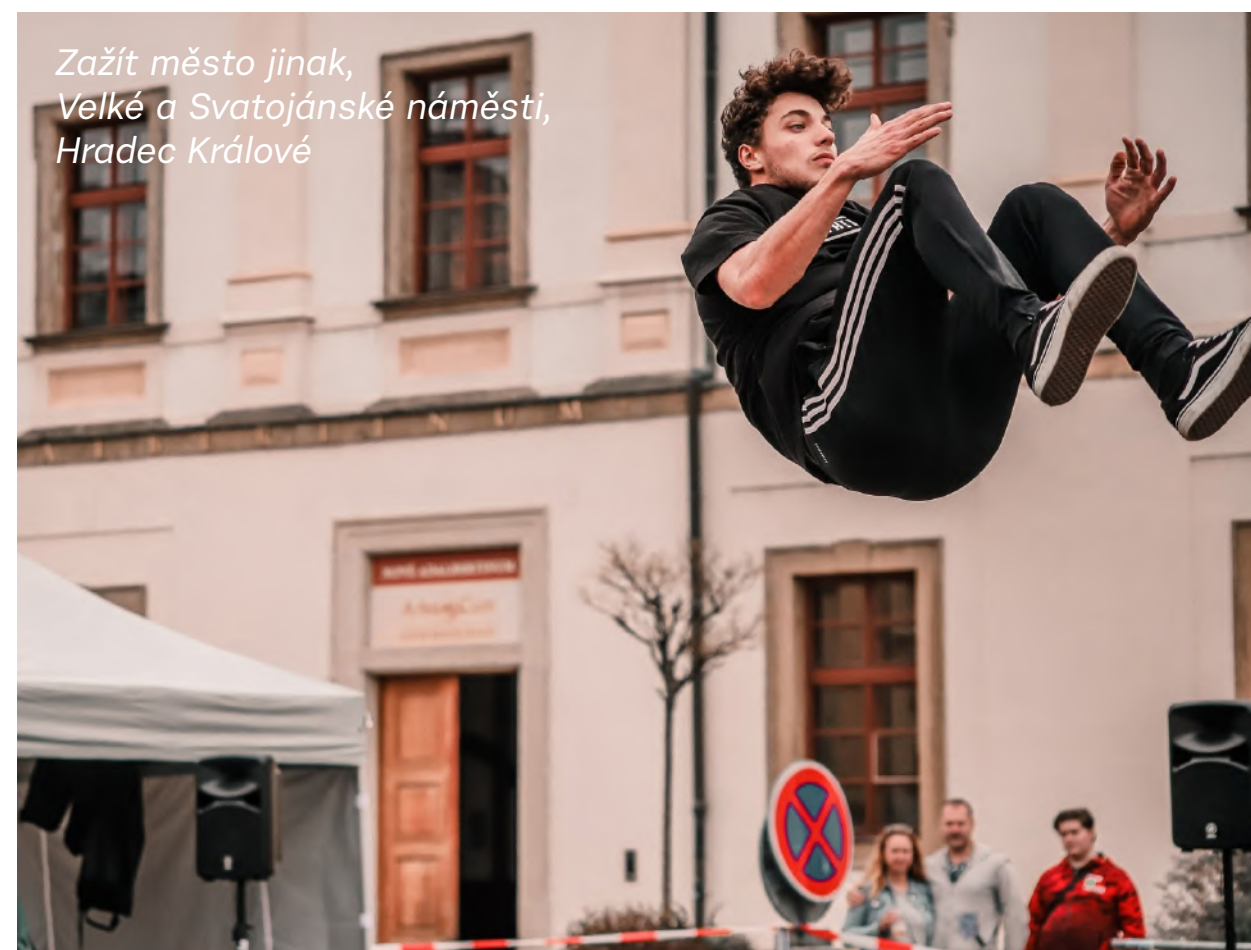
Zažít město jinak, Velké a Svatojánské náměstí, Hradec Králové