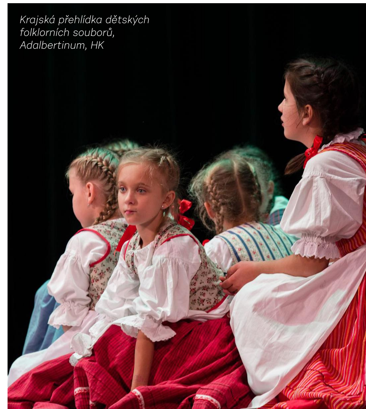
Krajská přehlídka dětských folklorních souborů, Adalbertinum, HK