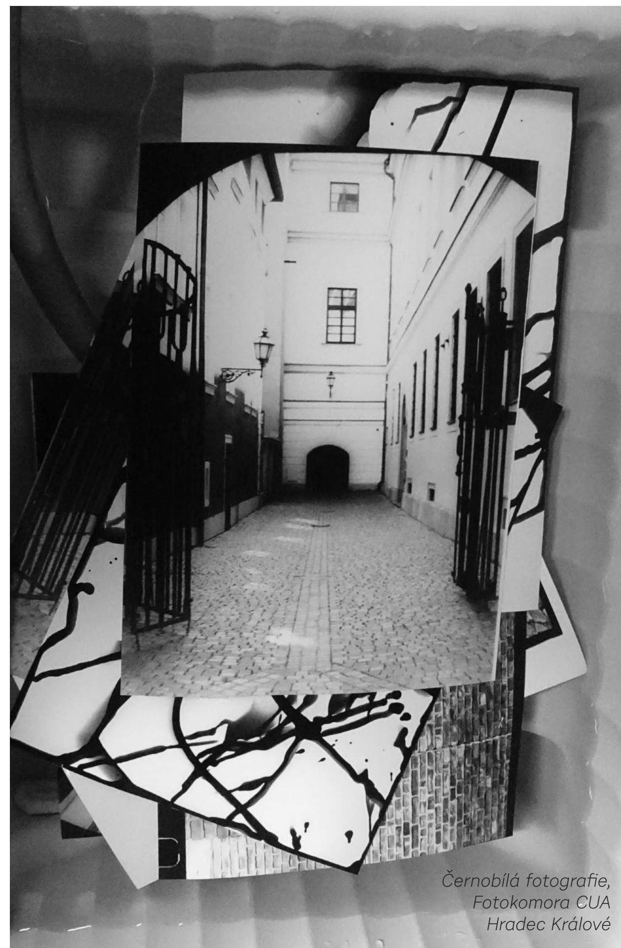
Černobílá fotografie, Fotokomora CUA Hradec Králové

Celkem bylo odučeno: 12 hodin Absolvovalo celkem: 7 fotografií (z důvodu kapacity fotokomory)