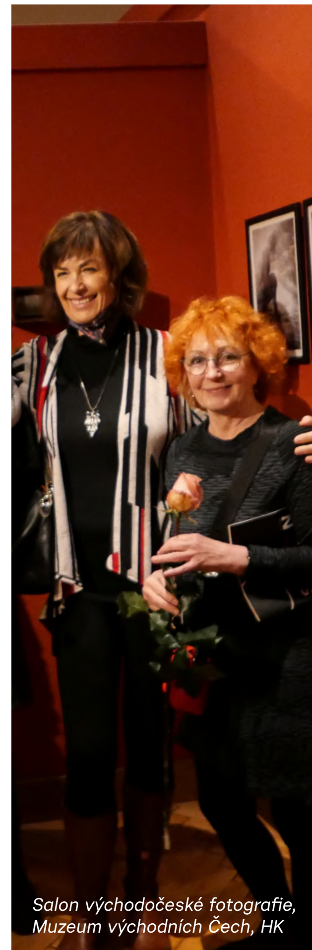
Salon východočeské fotografie, Muzeum východních Čech, HK

• 15. 11. 2021 – 14. 1. 2022 / PREMIÉRA 2021 vítězné fotografie 32. ročníku fotografické soutěže. V případě, že by byly z důvodu koronavirové pandemie opět zavřeny výstavní prostory, byla výstava nafilmovaná a divákům zprostředkována virtuálně.