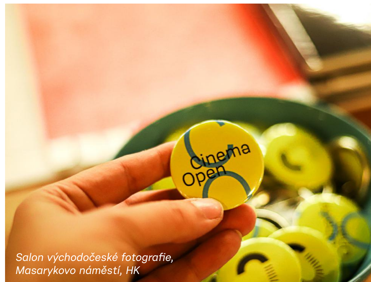
Salon východočeské fotografie, Masarykovo náměstí, HK

sdílení a využívání veřejných prostor je již 14 let jedním z pilířů činnosti pražského Auto*matu. Akce se konala v rámci Evropského týdne mobility, který proběhl v týdnu od 16.–22. 9. 2021.