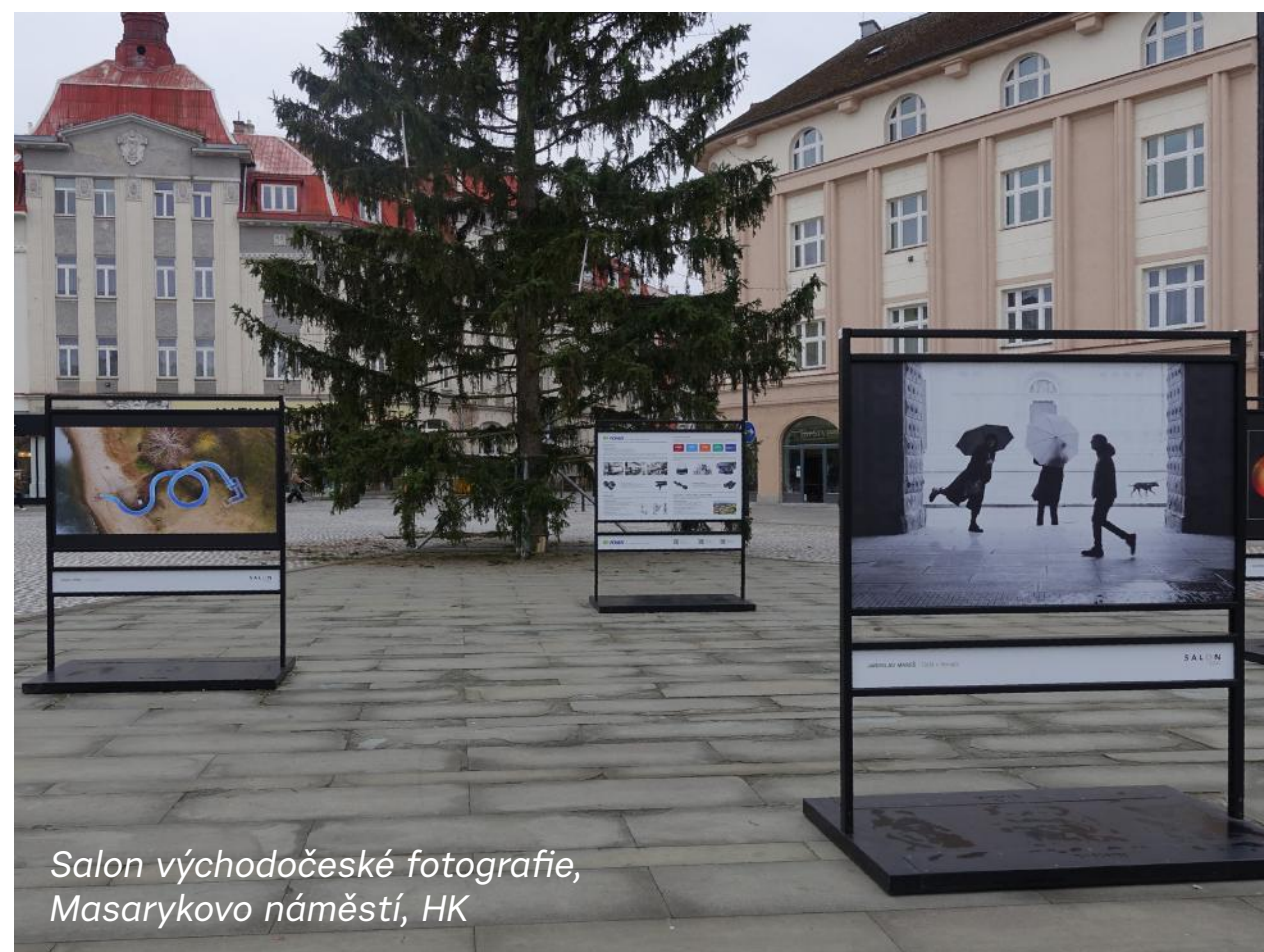
Salon východočeské fotografie, Masarykovo náměstí, HK