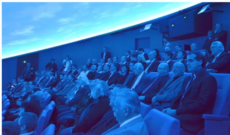
▲ Publikum těsně před začátkem projekce.

technologie. Díky věrnému zobrazení vesmíru si budou návštěvníci připadat jako posádka kosmické lodi. Nové planetárium snad podpoří zájem především mladé