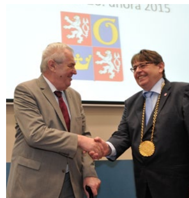
▲ V sále zastupitelstva KHK se sešel prezident Zeman se zastupiteli kraje a starosty obcí.