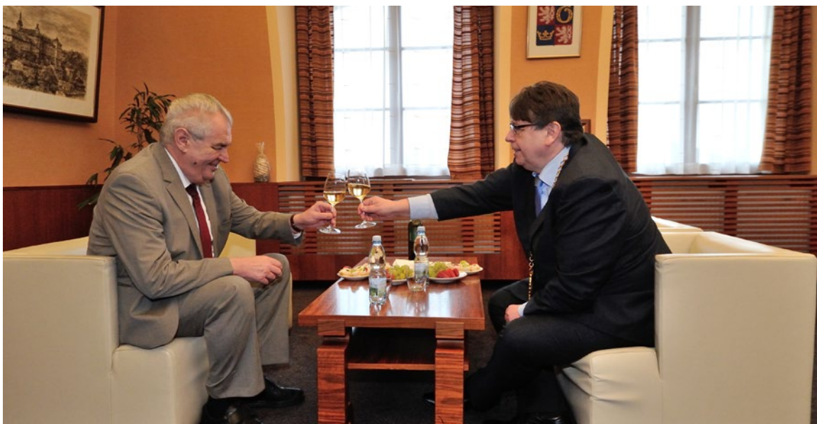
▲ Prezidenta Zemana přivítal první den hejtman Královéhradeckého kraje na půdě úřadu.

Ve dnech 18. - 20. února 2015 navštívil Královéhradecký kraj prezident Miloš Zeman. Na své cestě se zaměřil především na Rychnovsko a Trutnovsko. Přinášíme Vám podrobnou fotoreportáž z celé návštěvy. > red