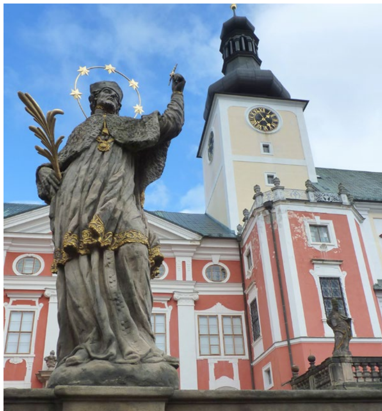
▲ Ve zdech Broumovského kláštera vznikne vzdělávací a kulturní centrum.

věže. Centrem kulturních událostí se stane původní dřevník, který byl v havarijním stavu, a nově zde vznikl divadelní a koncertní prostor umožňující realizovat při nepříznivém počasí programy při-