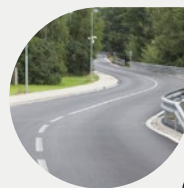
Seznam první várky silnic, které kraj v roce 2015 opraví