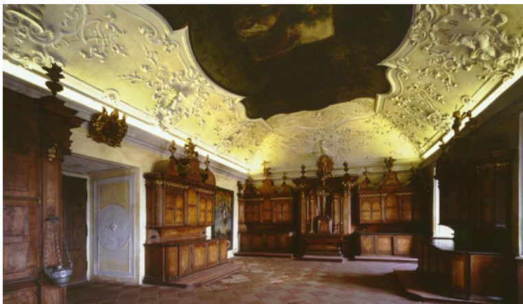
▲ Zrekonstruovaný klášterní interiér.

V klášterní zahradě byl opraven dům zahradníka i kuchaře a k opětovnému užití zrekonstruován kuželník. Doplněny a opraveny jsou zdi vytvářející terasy uvnitř zahrady i zeď obvodová. Nově se rozsvítil také pomník opata Jakuba II., který restaurátoři vysvobodili z nevhodné úpravy provedené v 70. letech dvacátého století. Technickou zajímavostí je opětovné zprovoznění vodárenské