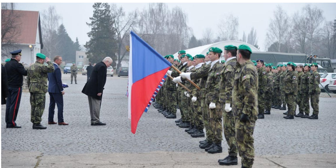
▲ Nástup jednotky 6. a 7. polní vojenské nemocnice v Hradci Králové.