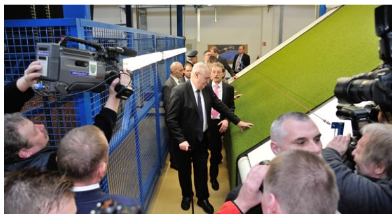
▲ V Jutě si prezident prohlédl výrobu a setkal se se zaměstnanci.