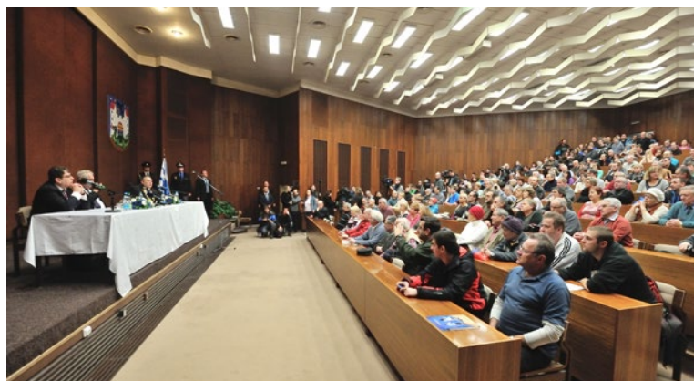
▲ Důležitá byla pro prezidenta Zemana hlavně setkání s občany.