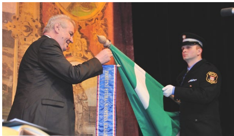
▲ Během své návštěvy dekoroval prezident prapory všech navštívených měst prezidentskou stuhou.