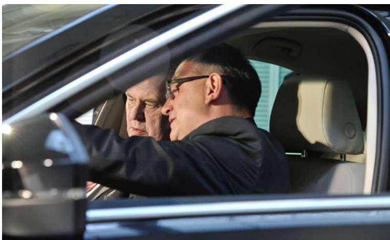
▲ Zeman bude prvním klientem Škodovky, který nový Superb dostane.