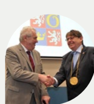
Fotoreportáž z návštěvy prezidenta Miloše Zemana v Královéhradeckém kraji