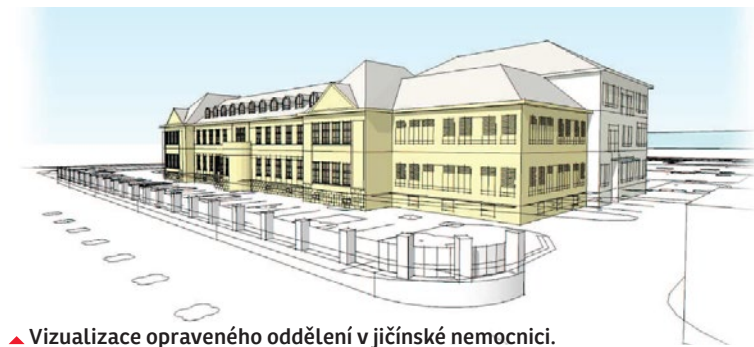
▲ Vizualizace opraveného oddělení v jičínské nemocnici.

Na evropské peníze by měla dosáhnout i náchodská nemocnice, kde v současné době probíhá rekonstrukce s plánovanou investicí asi za miliardu korun. Z evropských zdrojů by se pak na modernizaci zdravotnického vybavení mohlo čerpat až 300 milionů korun. ▶ red