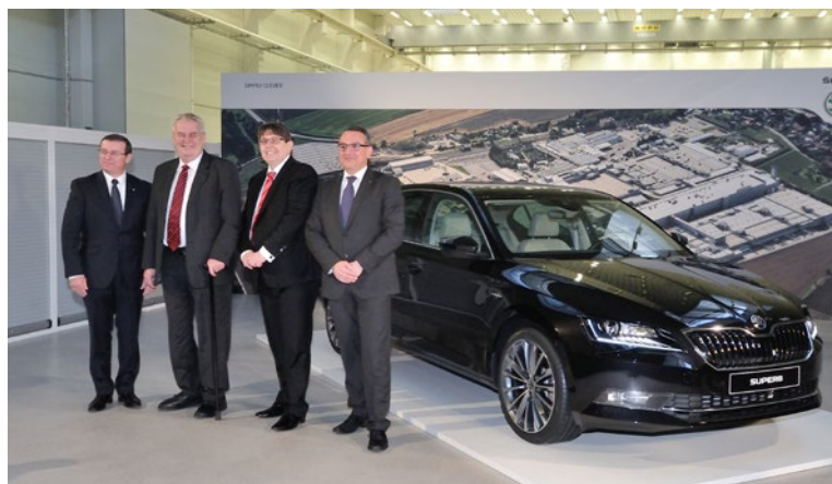
▲ Tady čekalo na prezidenta překvapení – zbrusu nový model Škody Superb.