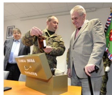
▲ Prezident dostal od vojáků dar Soupravu první pomoci.