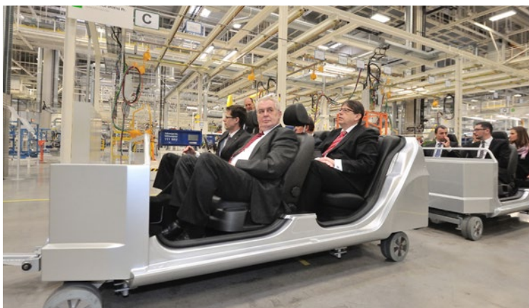
▲ Třetí den návštěvy v kraji patřil Rychnovsku a kvasínské Škodovce.