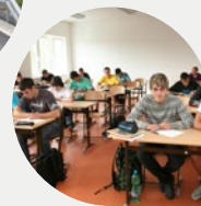
Přijímací řízení na střední školy 2015