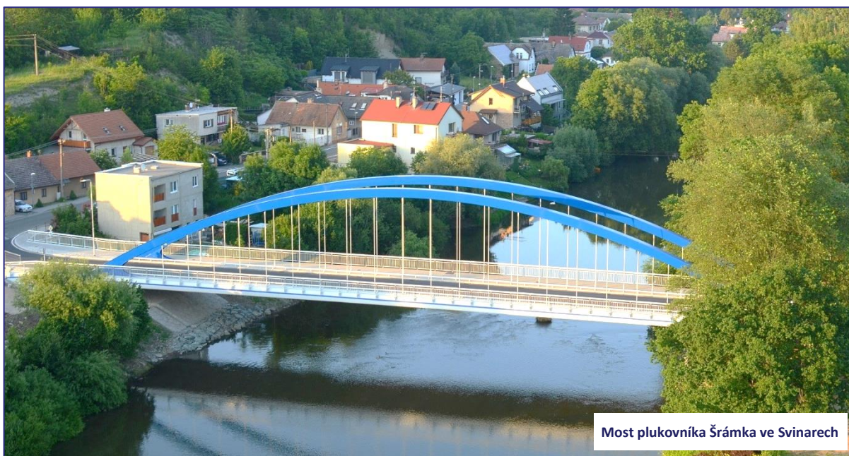
Most plukovníka Šrámka ve Svinarech

Dopravu v Královéhradeckém kraji chceme nejen udržet v současné kvalitě, ale chceme ji dále zlepšovat a rozvíjet, aby se postupně zlepšoval komfort cestujících nejen ve veřejné dopravě jako takové, ale zároveň v údržbě, opravách a investicích do krajské silniční sítě.