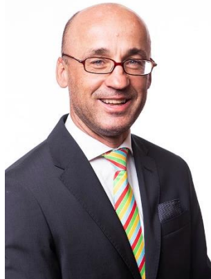
Rudolf Cogan náměstek hejtmána

oblast sociálních věcí, kultury a cestovního ruchu