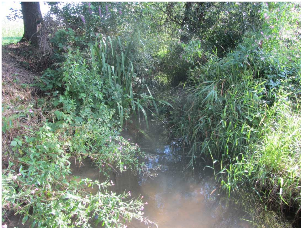
Foto č. 3 – Úsek nad silničním mostem na Tikov, úsek v částečném vzdutí od mostní konstrukce