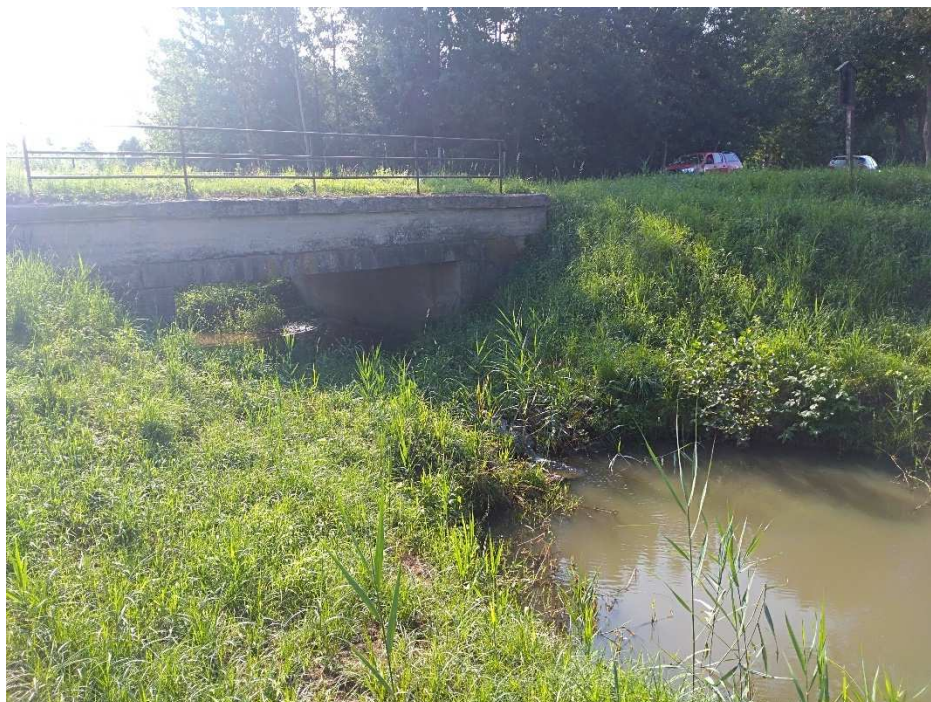
Foto č. 1 – Most u obce Černín, vytvořená tůň pod stabilizačním stupněm