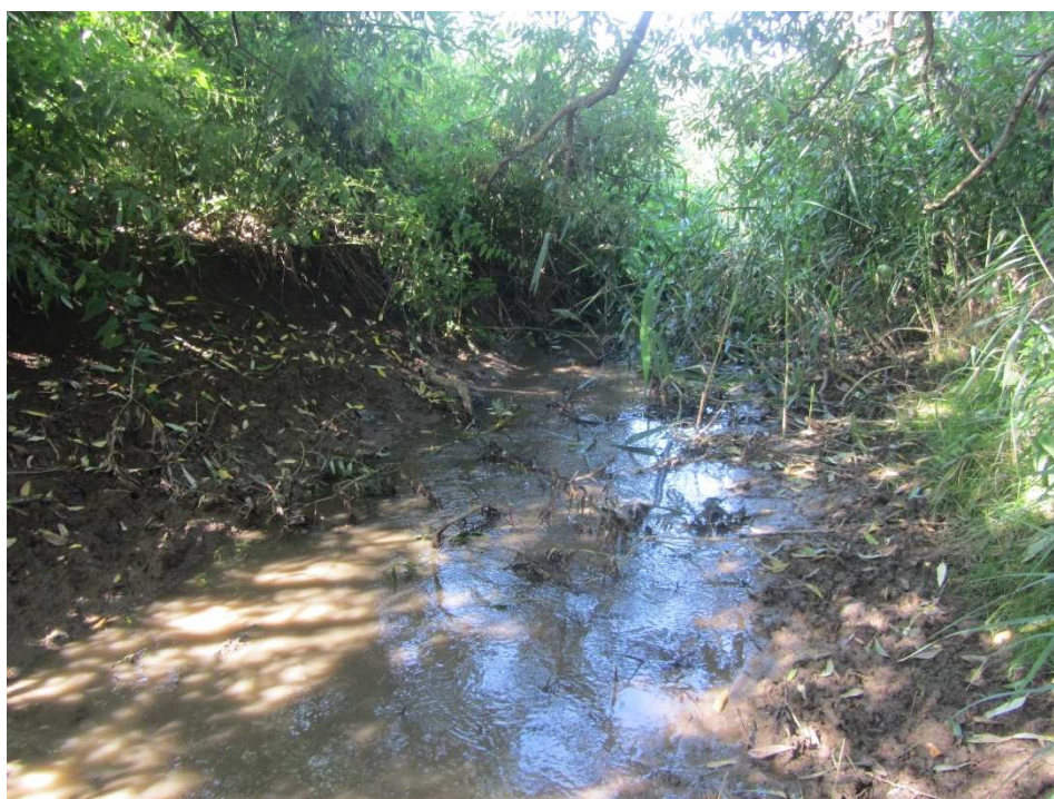
Foto č. 6 Charakter koryta před soutokem s Javorkou. Patrné bahnité sedimenty a zahloubené koryto