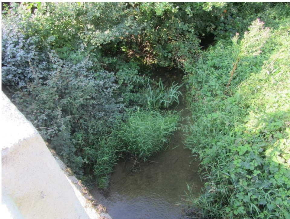
Foto č. 4 Pohled na charakter koryta pod mostem na Tikov