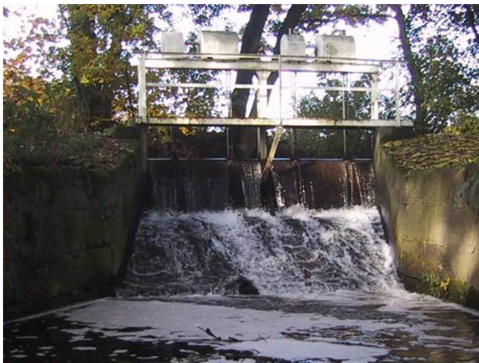
Foto č. 3 – Jez pod Březovicemi (ř. km 40,56), (Zdroj: GISyPoNET. http://igis.pla.cz/gisypo/ )