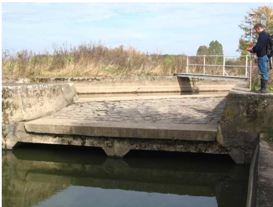
Foto č. 12 – Jez Nechanice (ř. km 22,50)