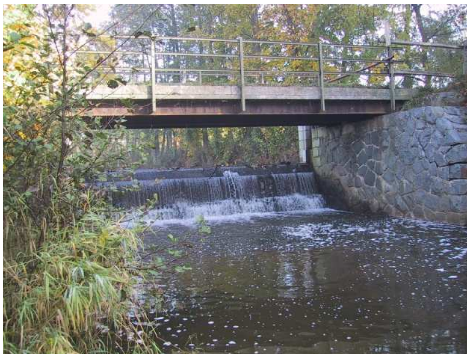
Foto č. 4 – Jez Jeřice (ř. km 38,93), (Zdroj: GISyPoNET. http://igis.pla.cz/gisypo/ )