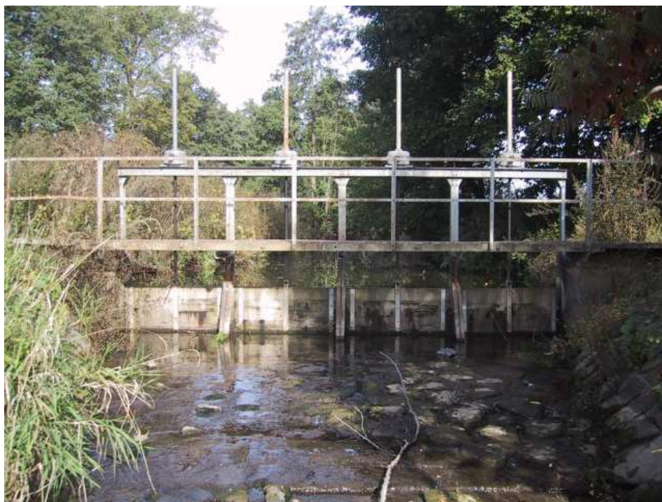
Foto č. 14 – Jez Kunčice (ř. km 17,65)