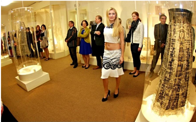
módní přehlídka slavnostní zahájení