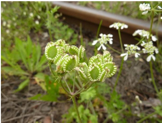
zapalička apulijská ( Tordylium apulum )

Nálezová databáze za rok 2015 obsahuje více než 2 tisíce floristických údajů. Bylo též pořízeno několik desítek herbářových sběrů (např. Ambrosia artemisiifolia , Centaureum pulchellum , Coleanthus subtilis , Eragrostis minor , Illecebrum verticillatum , Puccinellia distans , Sanguisorba officinalis , Silaum silaus a další).