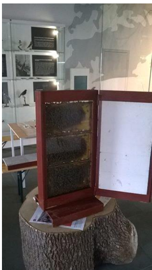
Tajupný včelí svět