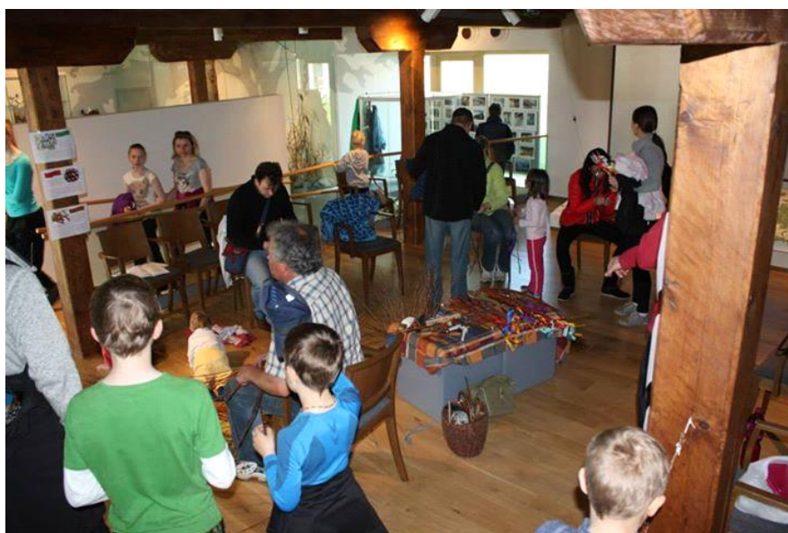
Velikonoce v muzeu