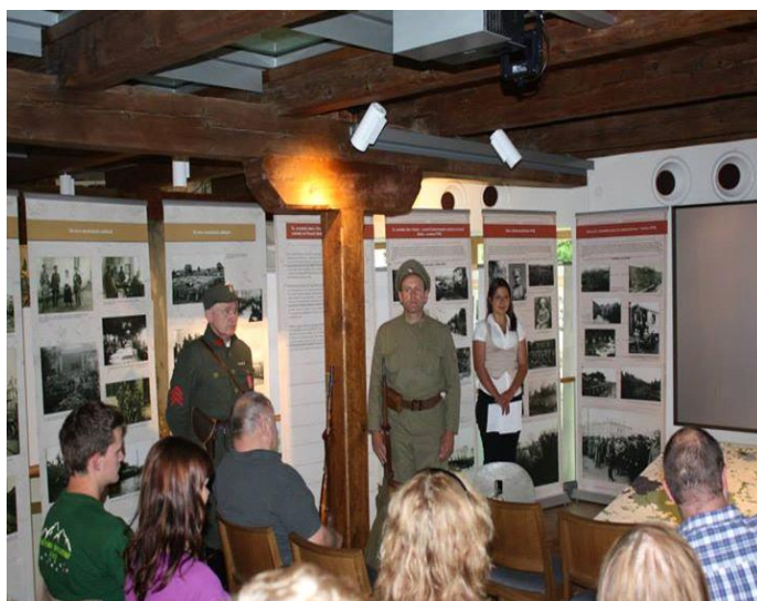
100 let legií