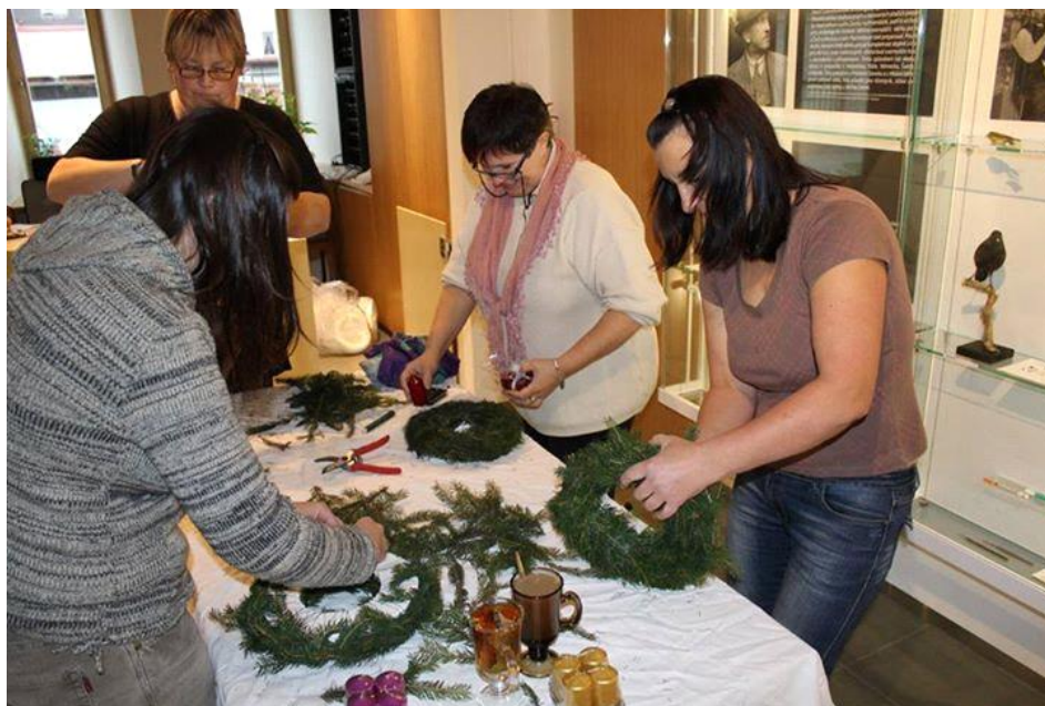
Advent v muzeu