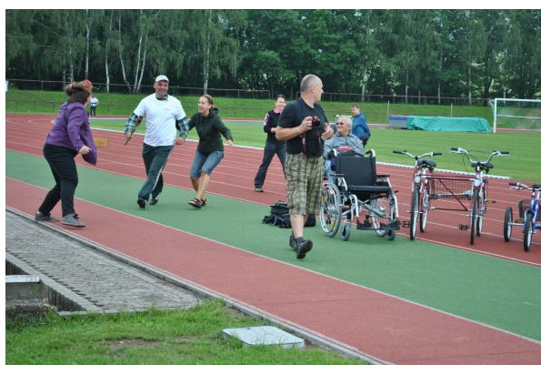
Závěr štafety s NONAlympijským ohněm a zahájení her ...