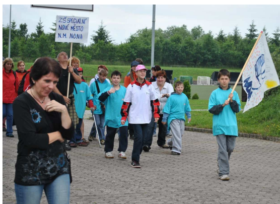
Nástup na stadion.