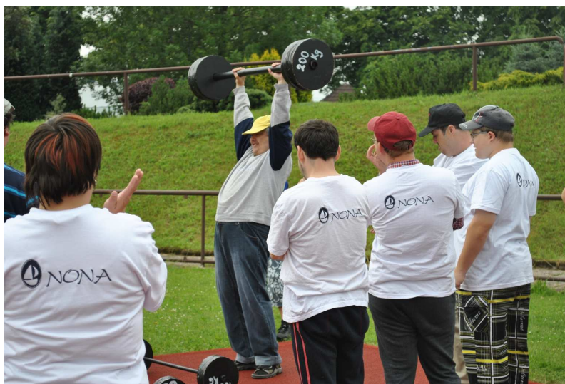
Zástupce domácích ... bez zaváhání !!!