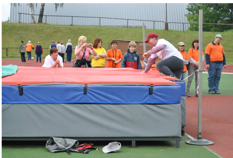
Ilustrační foto – jeden z výkonů ...