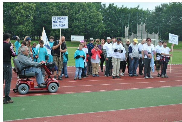
Předseda Mňuk při zahájení.