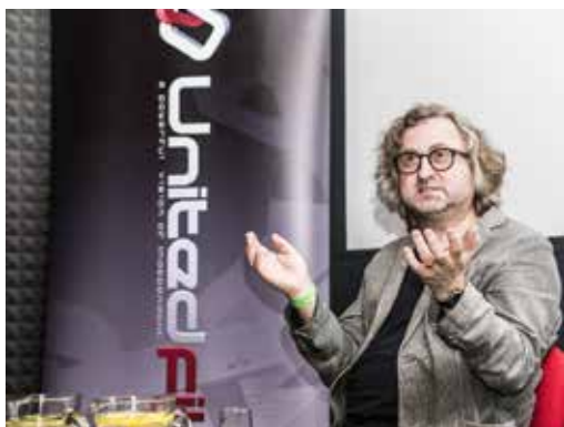
Master class Jan Hřebejk