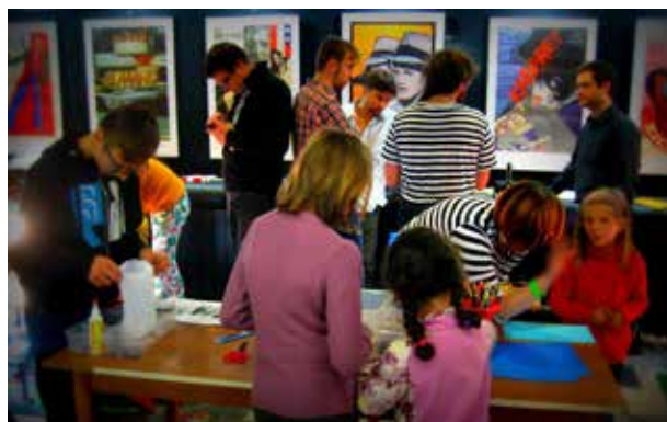
Cinema Open 2014