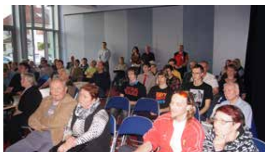
Krajská filmová soutěž Český videosalon