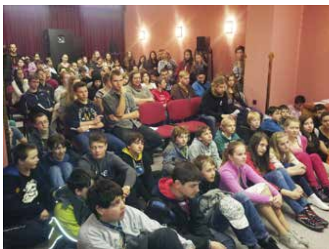
Filmová přehlídka náchodská Prima sezóna

Filmaři využívali tradičně možnosti poradenství a technické výpomoci videostudia formou konzultací či zapůjčení techniky. V prostorách studia našli zázemí členové Klubu filmové tvorby, seminaristé Školy AVT a vybavení pro záznam posloužilo i k průběhu praktického dvoudenního filmového semináře konaného pro studenty Gymnázia v Moravské Třebové či pro praktický seminář žurnalistiky pro Gymnázium J.K. Tyla v Hradci Králové.