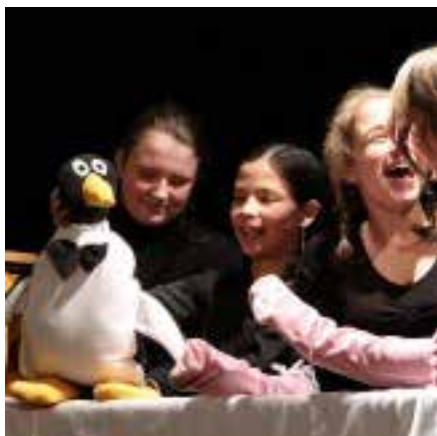
DLS Blechy Jaroměř

V Královéhradeckém kraji postupovými koly pro děti a mládež, pořádanými v měsících únoru, březnu a dubnu prošlo celkem cca 1 501 aktivních účastníků . Součástí všech byly rozborové semináře a pohovory s porotou.