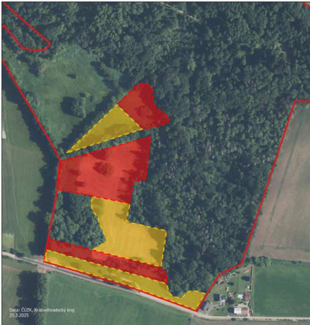
Obr. Schematické znázornění ploch určených ke kosení (žlutě a červeně) Přírodní památka Bělohradská bažantnice - jižní část