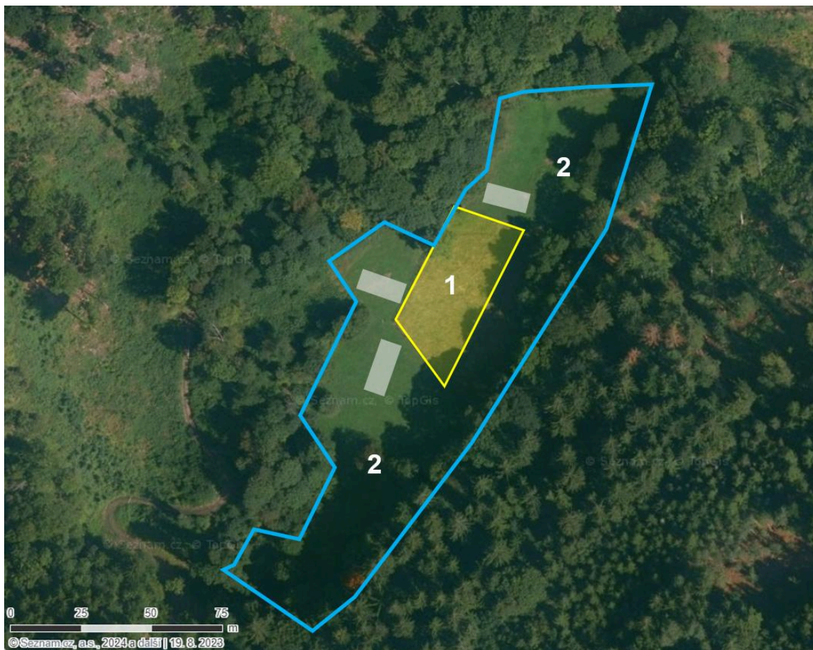
Příloha č. 1: Schematické znázornění ploch k seči (modře vyznačena plocha celé louky, žlutě vyznačená plocha oplocenky, bíle jsou vyznačeny pruhy pro kosení podzimním termínu)