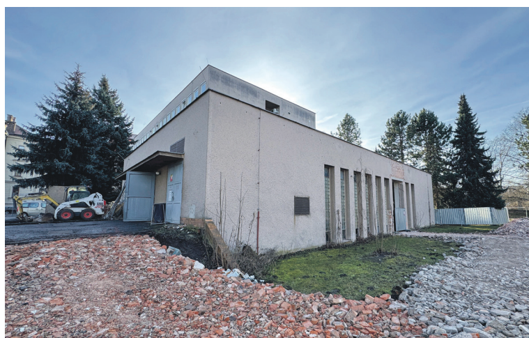
Budova bývalého výměníku se stane novou jídelnou.

s návazností na výtah. Součástí projektu je zateplení pětipodlažní administrativní budovy, výměna několika zbývajících oken a vybudování prosklené stěny schodiště.