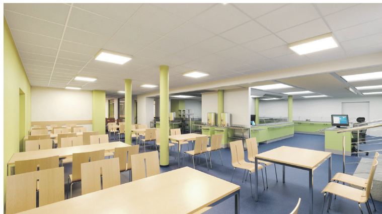
Vizualizace budoucí jídelny.

Nové stravovací zařízení kraj vybuduje v bývalé jednopodlažní výměníkové stanici a pětipodlažní administrativní budově. Stavbaří celkově změní dispoziční řešení současných prostor a vznikne nové podlaží uvnitř objektu. V suterénu výměníkové stanice bude hlavní vstup do jídelny pro strážníky, další místnosti pro kanceláře, výdejny s výtahovým propojením s prvním patrem, místnosti na mytí stolního nádobí, hygienické zázemí a dvě strojovny.