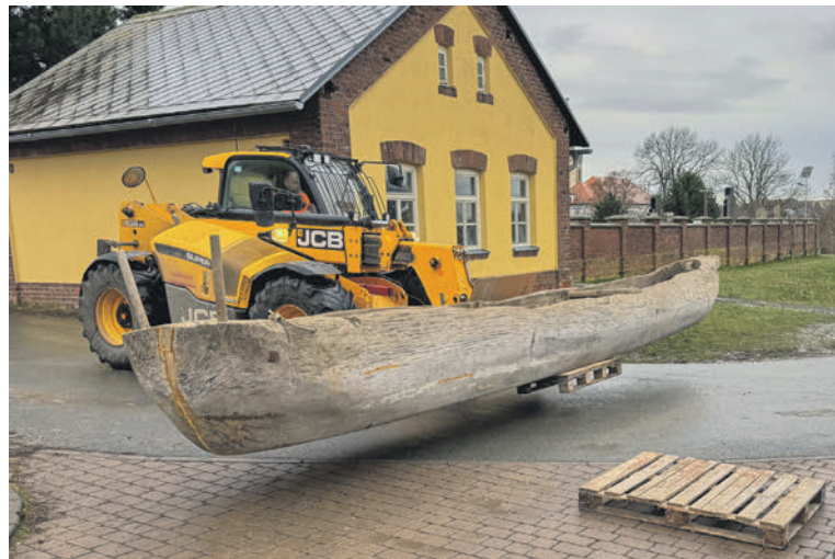
Na valník a z valníku se dřevěný dlabaný člun dostal pomocí nakladače. Tím skončila ta jednodušší část.