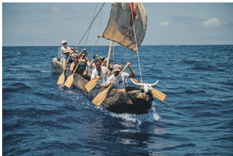
Expedice Monoxylon III potvrdila, že bylo možné na jednoduchém plavidle z kmene stromu přeplout z Řecka na Krétu, a tak před osmi tisíci lety překonávat velké vzdálenosti na moři. (Naši předci trasu samozřejmě nepluli celou, ale „skákali“ z ostrůvku na ostrůvek, až se dostali k pevnině.)