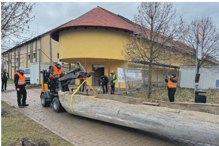
K archeoparku vede jen úzká cestička, takže se ke slovu dostaly malé zvedáky. Až bude rekonstrukce hotová, vystavené zde budou i archeologické sbírkové předměty Muzea a galerie Orlických hor a výsledky průzkumů z dálnice D11.