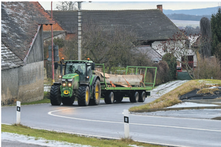
Dřevěný monoxylon bylo třeba přestěhovat z Hořiněvsi, kde byl po skončení třetí expedice v roce 2019 uložený.