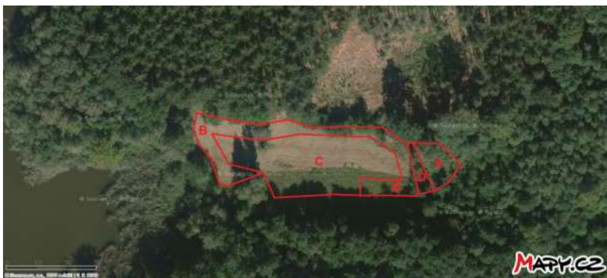
Obr. 1 Umístění managementu v dílčích plochách A–D na slatinné louce u rybníka Bahník

Kosení travního porostu slatinných luk a rozrůstajících se rákosin a odvoz biomasy na části pozemku p. č. 599, k. ú. Lukavec u Hořic ve dvou sečích (obr. 1, plocha B – kosení 15.6.–30.6., plocha A, C, D – kosení 15.8.–15.9.). Kosení bude provedeno křovinořezem nebo ručně vedenou sekačkou. Veškerá vzniklá biomasa spolu se stařinou bude důkladně vyhrabána a odvezena z území přírodní památky Byšičky 1 a jejího ochranného pásma.