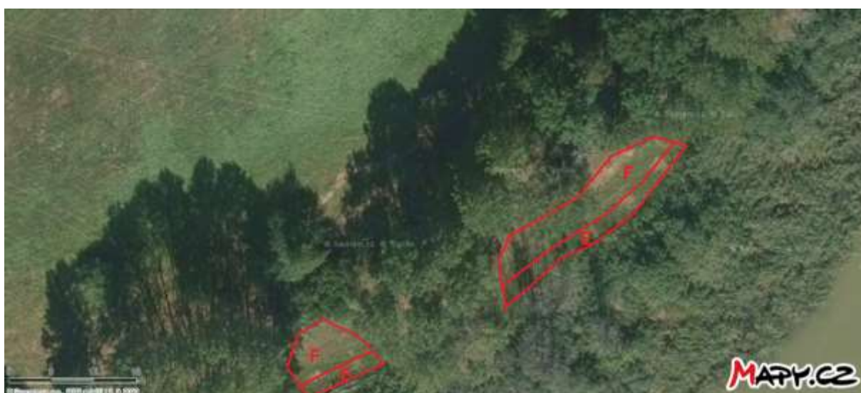
Obr. 2 Umístění managementu v dílčích plochách E, F na louce u Zákopského rybníka

Kosení travního porostu a rozrůstajících se rákosin na louce u Zákopského rybníka na části pozemku p. č. 580, k. ú. Lukavec u Hořic ve dvou sečích (obr. 2, plocha E – kosení 15.6.–30.6., plocha F – kosení 15.8.–15.9.). Kosení bude provedeno křovinořezem nebo ručně vedenou sekačkou. Veškerá vzniklá biomasa spolu se stařinou bude důkladně vyhrabána a odvezena z území přírodní památky Byšičky 1 a jejího ochranného pásma.