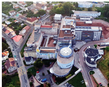
Náchodská nemocnice zvrchu.

Kolaudační souhlas pro budovy Ja K náchodské nemocnice obdržel Královéhradecký kraj na začátku srpna. Samotná stavba dvou nových pavilonů za více než miliardu a půl skončila na konci července. Nedávné obavy, že kvůli pandemii koronaviru a nedostatku zahraničních pracovníků stavba nabere zpoždění, se tak nenaplnily. |