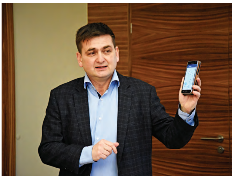
Mobilní aplikace IDS IREDO přináší nové služby pro cestující ve východočeském Regionu, kteří v ní naleznou všechny potřebné informace o autobusových i vlakových spojích. Veřejnosti ji představil první náměstek hejtmána Martin Červíček odpovědný za oblast dopravy. Více informací přineseme v příštím čísle U nás v kraji.