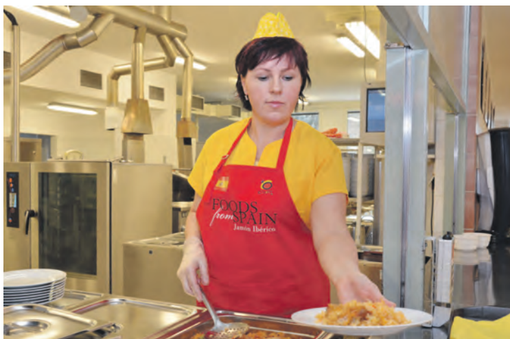
Na ZŠ Milady Horákové se uskutečnil Den Španělské kuchyně. Akci navštívil i španělský velvyslanec Pedro Calvo-Sotelo Ibañez-Martín.