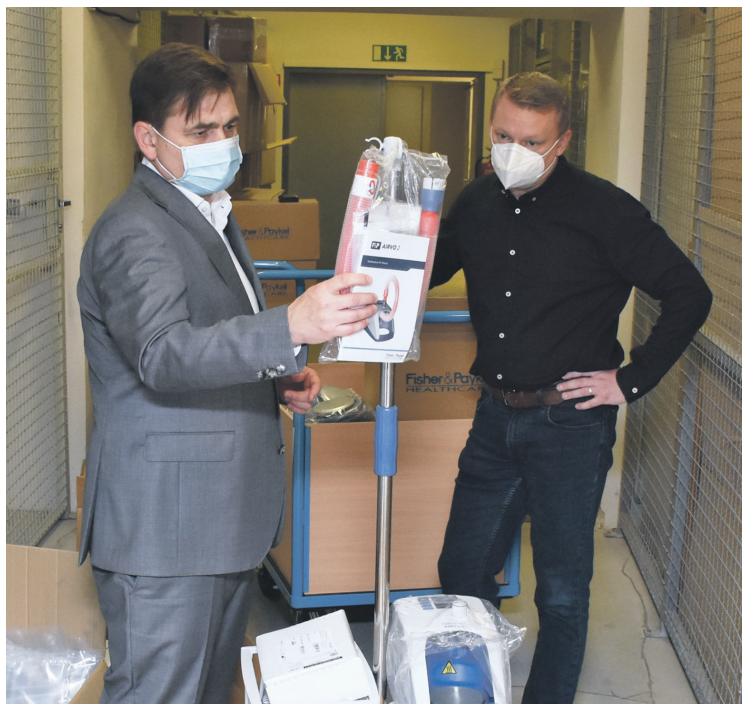
S přístrojem HFNO se před rozvozem do kraje seznámil hejtman Martin Červíček.

Královéhradecký kraj v rámci boje proti koronaviru distribuje ochranné pomůcky a do nemocnic s pomocí hasičů rozvezl také 99 HFNO přístrojů pro vysokopřítokovou kyslíkovou léčbu, která se využívá během hospita-