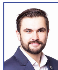
Pavel Bulíček 1. náměstek hejtmána Piráti