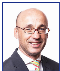
Rudolf Cogan náměstek hejtmána ODS-STAN-VČ