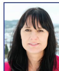
Martina Vágner Dostálová předsedkyně Výboru pro životní prostředí a zemědělství Piráti