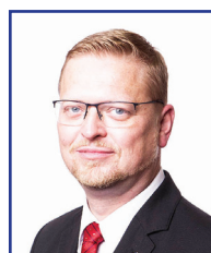
Pavel Bělobrádek 2. náměstek hejtmána Koalice pro Královéhradecký kraj