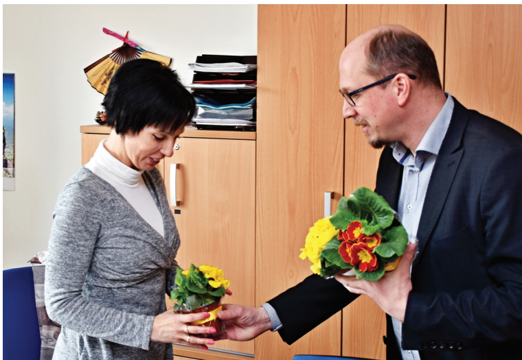
I když Mezinárodní den žen připadl na neděli, hned v pondělí dopoledne hejtmán Jiří Štěpán obešel pracovnice krajského úřadu, aby každé poblahopřál a věnoval jí kytičku primulek.