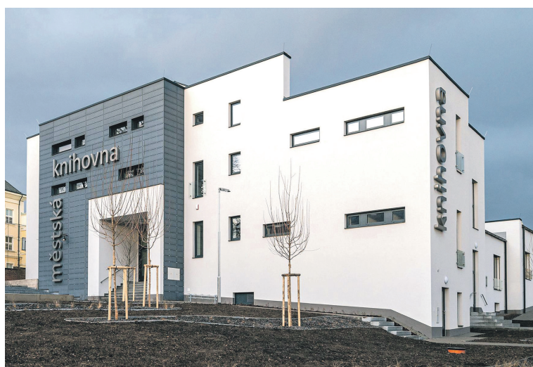
Nová budova knihovny v Rychnově nad Kněžnou na začátku roku 2020 úspěšně prošla kolaudací a veřejnosti se otevře během dubna, pokud to vládní nařízení umožní. Město budovu za 98 milionů korun věnovalo rychnovskému rodákovi Karlu Poláčkovi.