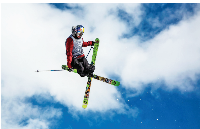
Poslední únorový víkend se nejlepší světovní freeskiéři a nově i freeskiérky setkali na osmém ročníku závodu Soldiers ve Deštném v Orlických horách, který významnou částkou podpořil i Královéhradecký kraj. Závodníci na lyžích předváděli dechberoucí kousky.