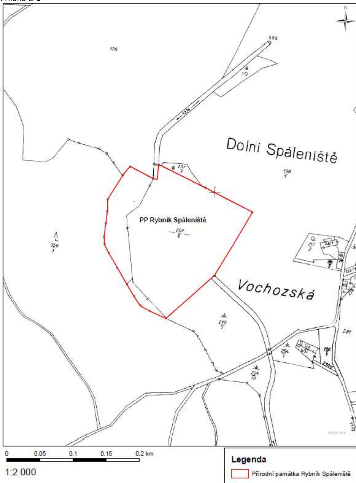
Příloha č. 1