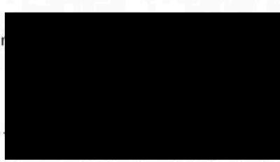
hejtman Královéhradeckého kraje