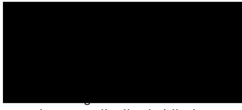
hejtman Královéhradeckého kraje