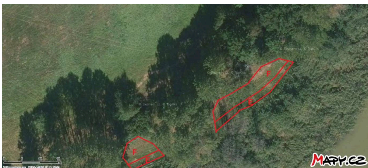
Obr. 2 Umístění managementu v dílčích plochách E, F na louce u Zákopského rybníka

Kosení travního porostu a rozrůstajících se rákosin na louce u Zákopského rybníka ve dvou sečích (obr. 2, plocha E – kosení 15.6.–30.6., plocha F – kosení 15.8.–15.9.). Kosení bude provedeno křovinořezem nebo ručně vedenou sekačkou. Veškerá vzniklá biomasa spolu se stařinou bude důkladně vyhrabána a odvezena z území přírodní památky Byšičky 1 a jejího ochranného pásma.