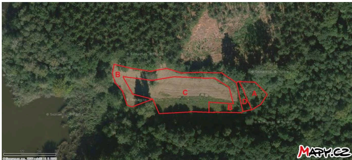
Obr. 1 Umístění managementu v dílčích plochách A–D na slatinné louce u rybníka Bahník

Vykácet všechny dřeviny po obou stranách příkopu v pruzích o šířce 4 metry (plocha D) v termínu 15.9.–15.10. za účelem uvolnění prostoru pro kosení a vyhrabávání v následujících letech a pro snížení množství opadaného listí ve slatinné louce, které je zdrojem rostoucí trofie prostředí.