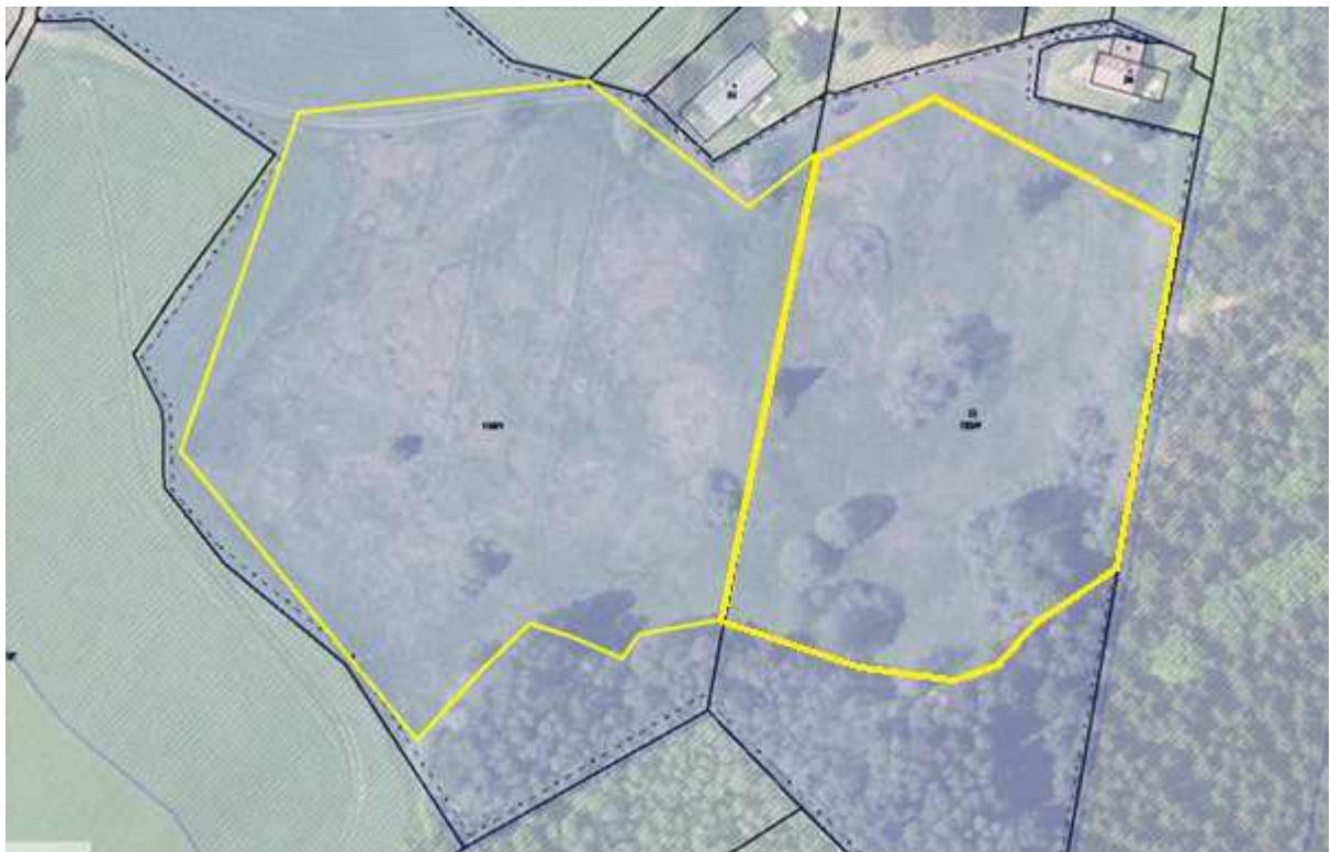
Příloha č. 2: Červeně je vyznačen vstup do přírodní památky, modře je vyznačena plocha s omezením vstupu