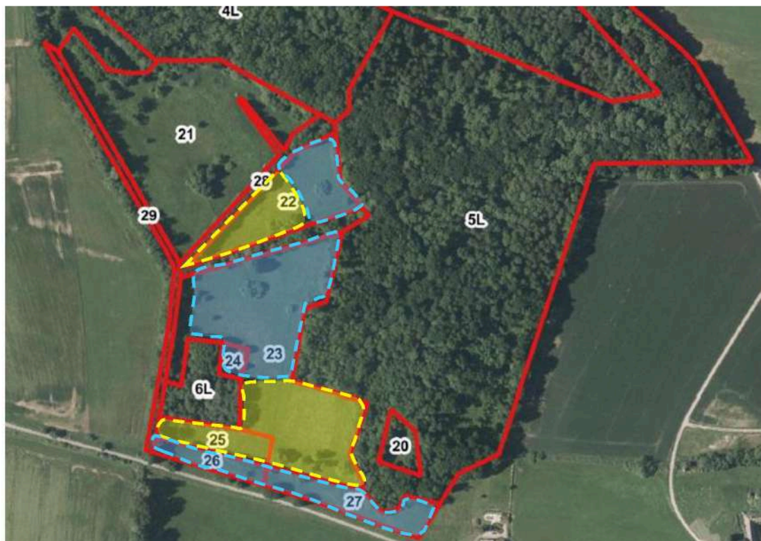
Obr. Schematické znázornění ploch určených ke kosení (žlutě a modře)

Celková výměra kosených ploch je 5,1 ha.