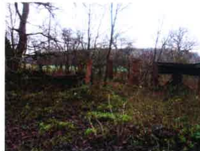
FOTOGRAFIE STÁVAJÍCÍHO STAVU DVORU