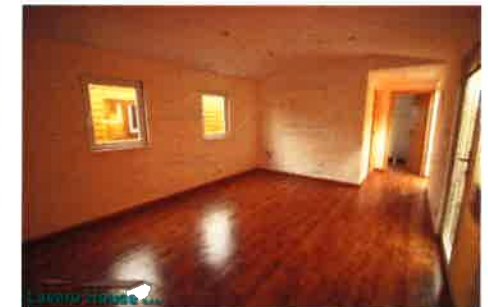
FOTOGRAFIE VZOROVÉHO MOBILNÍHO DOMU

TERAPEUTICKÉ CENTRUM COMUNITA IN DIALOGO, DOBRUŠKA-BĚŠTUVINY