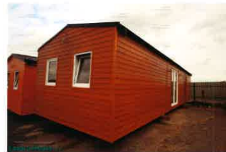
FOTOGRAFIE VZOROVÉHO MOBILNÍHO DOMU