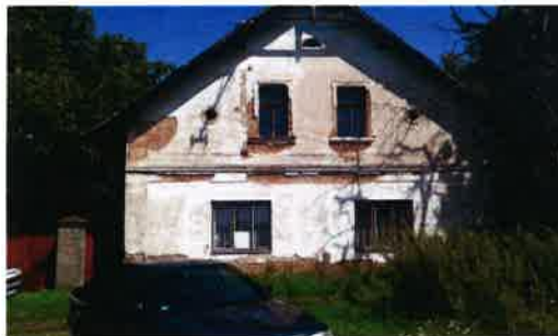
FOTOGRAFIE STÁVAJÍCÍHO DOMU

CELKOVÁ ODHADOVANÁ VÝŠE ..... 6 430 000,- Kč NÁKLADŮ (bez DPH)