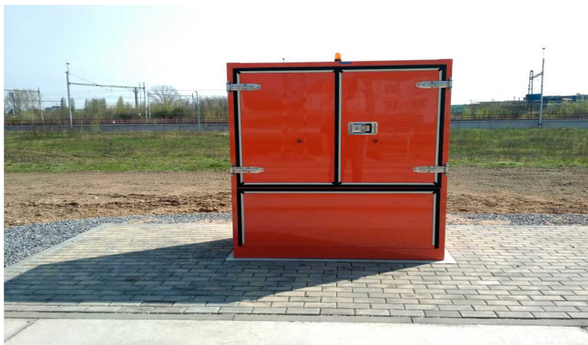
Obrázek 5 až 7- ilustrativní fotografie obdobné odsávacího a zbrojícího zařízení

V dodatku předložené dokumentace záměru jsou také zobrazeny následující ilustrativní fotografie obdobné odsávacího a zbrojícího zařízení z nichž je patrný vzhled a velikost.