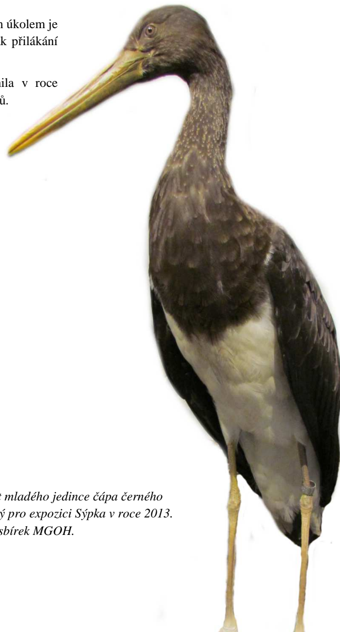
Preparát mladého jedince čápa černého vytvořený pro expozici Sýpka v roce 2013. Součást sbírek MGOH.

Návštěvnost expozice Sýpka činila v roce 2016 celkem 6666 evidovaných návštěvníků.