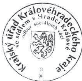
Bc. Tomáš Grulich referent oddělení sociální práce, prevence a sociálně právní ochrany

Upozornění o odvolání: Proti tomuto rozhodnutí se lze dle § 81 správního řádu odvolat do 15 dnů ode dne jeho oznámení, a to podáním učiněným u správního orgánu Krajský úřad Královéhradeckého kraje, odbor sociálních věcí, Pivovarské náměstí 1245, 500 03 Hradec Králové, který rozhodnutí vydal. O podaném odvolání rozhoduje Ministerstvo práce a sociálních věcí ČR.