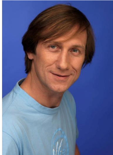
Jan Antonín Duchoslav

Prvním mediální tvář v historii soutěže se pro 14. ročník stal populární herec Jan Antonín Duchoslav.