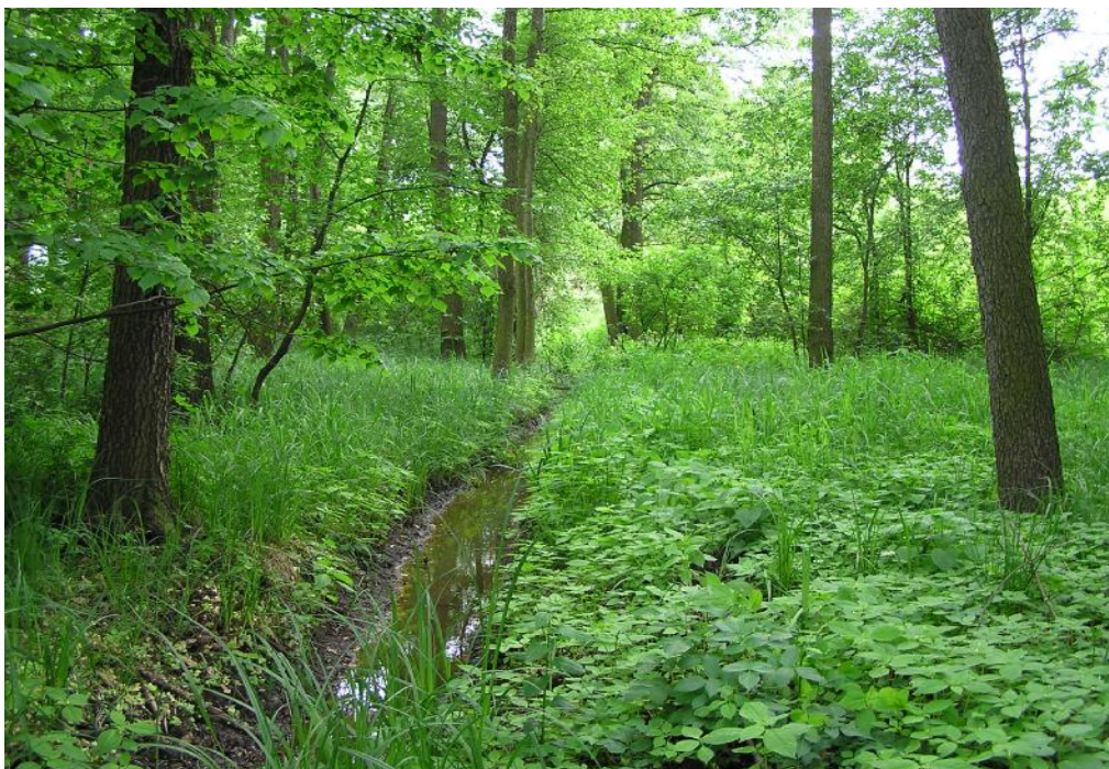
Obr.č. 35. Podmáčená olšina podél vodoteče mezi sádkami a hájovnou u rybníka Datlík