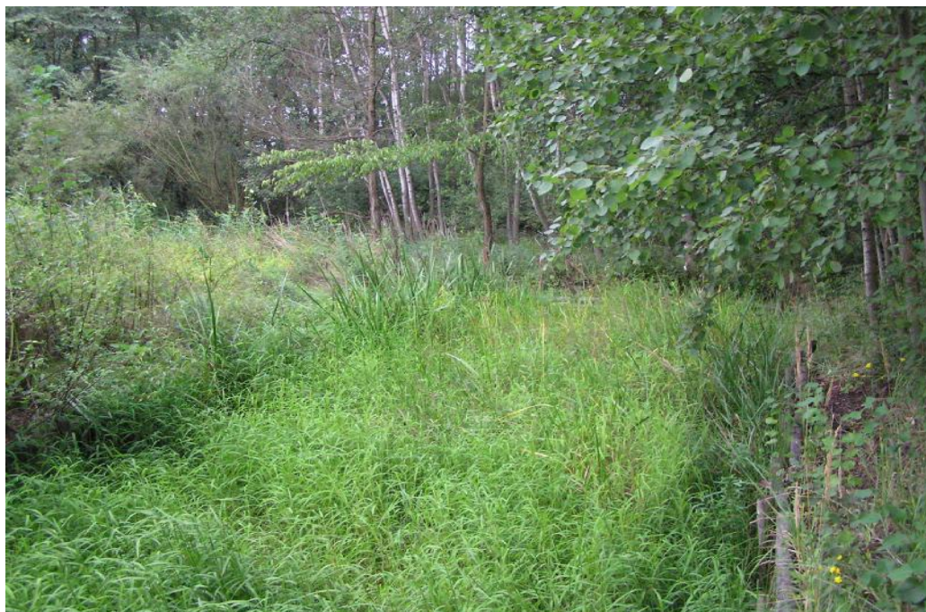
Obr.č. 30. Zarostlé sádky – 1. u hráze rybníka Datlík – porost tajničky rýžovité ( Leersia oryzoides )