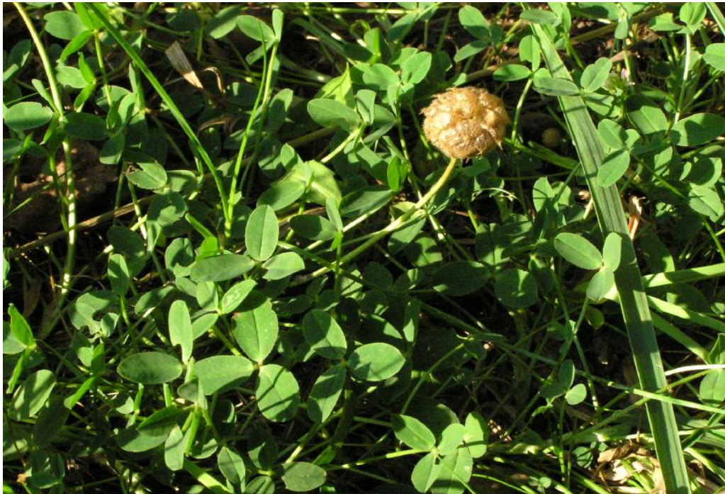
Obr.č. 33. Jetel jahodnatý ( Trifolium fragiferum ) – zarostlé sádky u hráze rybníka Datlík