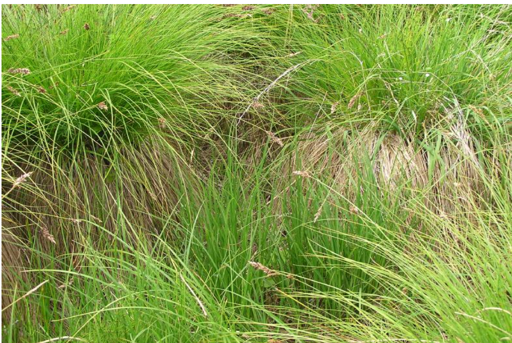
Obr.č. 28. Porost vysoké ostřice tvořící buly (o. odchýlná – Carex appropinquata ) - detail