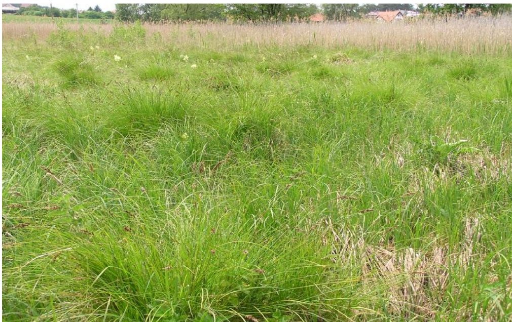
Obr.č. 27. Porost vysoké ostřice tvořící buly (o. odchýlná – Carex appropinquata ) a navazující rákosina