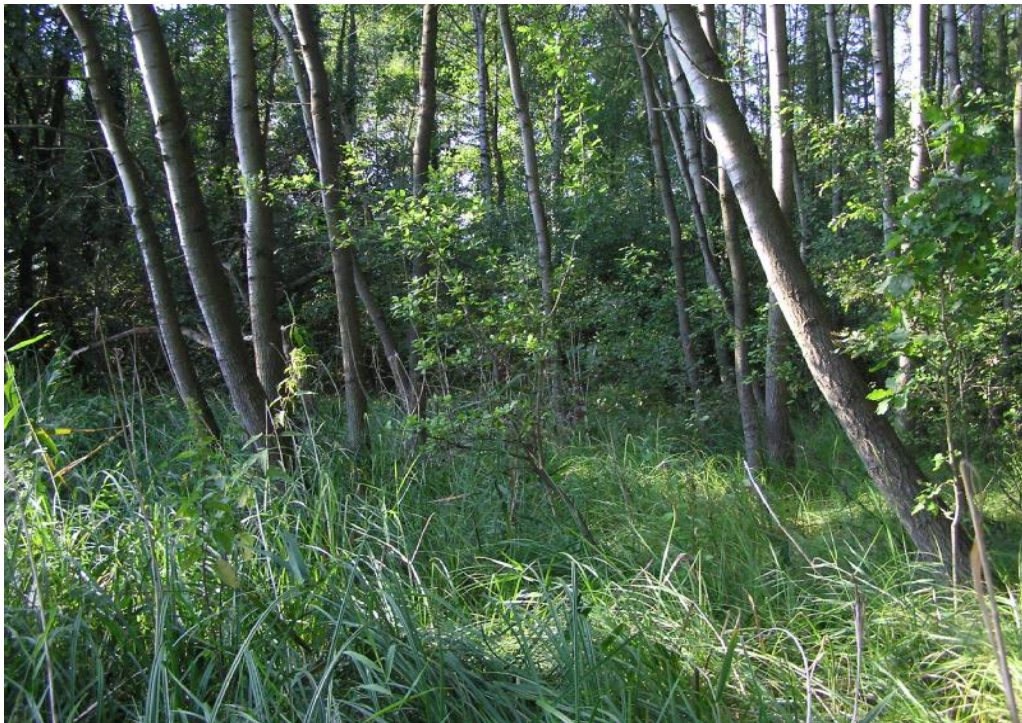
Obr.č. 32. Podmáčená olšina u sádek u hráze rybníka Datlík