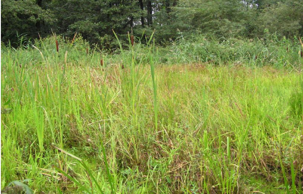
Obr.č. 31. Zarostlé sádky – porosty obojživelných rostlin, orobince a vysokých ostřic