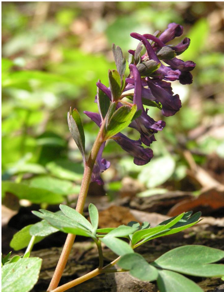
Obr.č. 37. Dymnivka plná ( Corydalis solida ) - detail