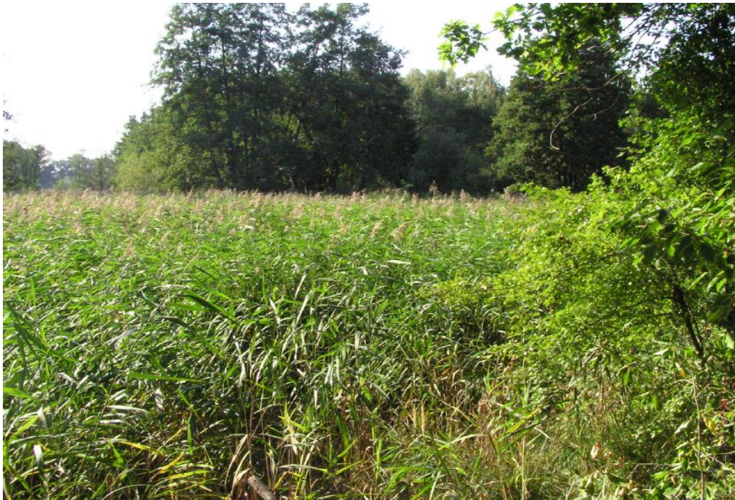
Obr.č. 34. Zarostlá vodní plocha vedle sádek – dominance rákosu